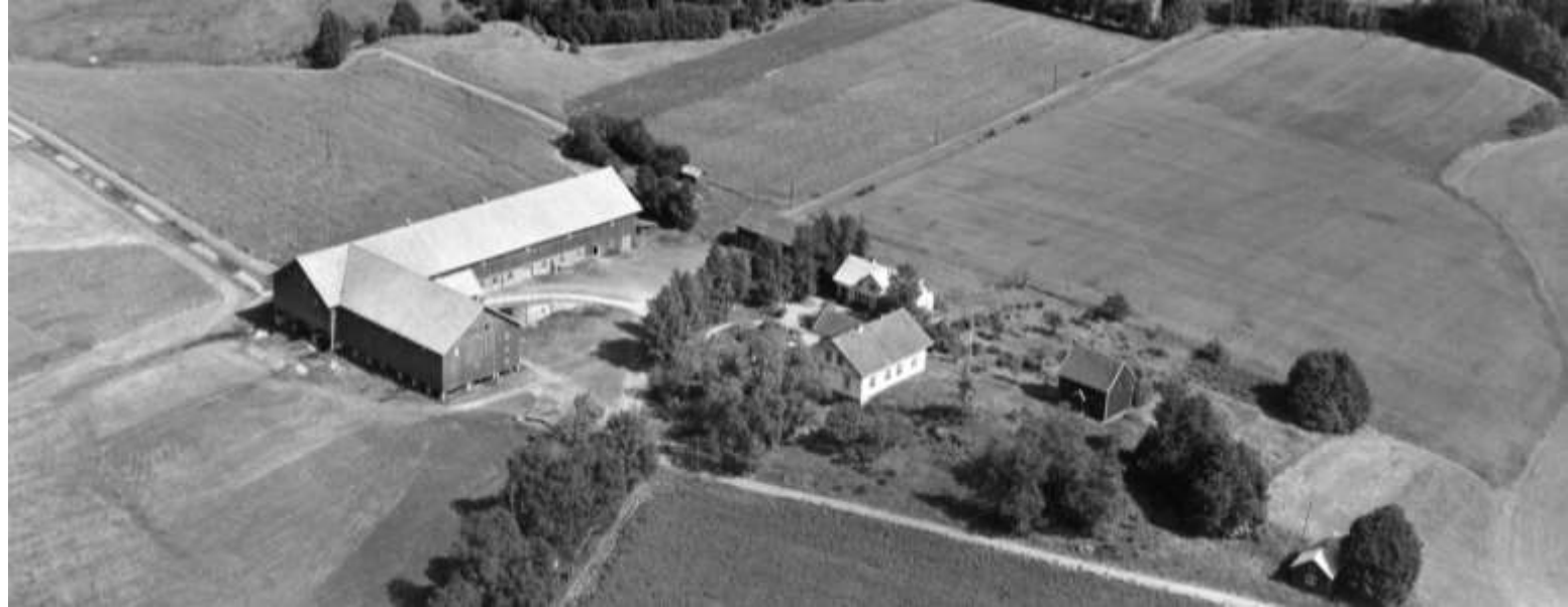
Bilde av Sandaker anno 1952