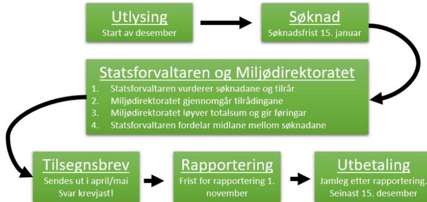
Figur 1: Søknadsprosessen