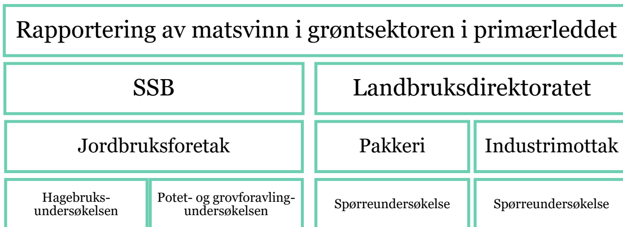
Figur 2: Oversikt over viktige aktører i kartleggingen av matsvinn i grøntsektoren

Landbruksdirektoratet innhenter data om matsvinn fra pakkerier og råvaremottak i foredlingsindustrien. I denne forbindelse skal bedriftene registrere og rapportere matsvinn som oppstår på dette stadiet og før videre industriell foredling av produktene. SSB innhenter opplysninger om matsvinn fra jordbruksforetak som en del av etablerte faste undersøkelser. Til sammen anser vi dette som grøntsektorens matsvinn i primærleddet i matkjeden.