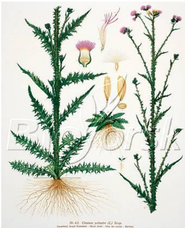
Illustrasjon: Ernst Quertus Myrtistel