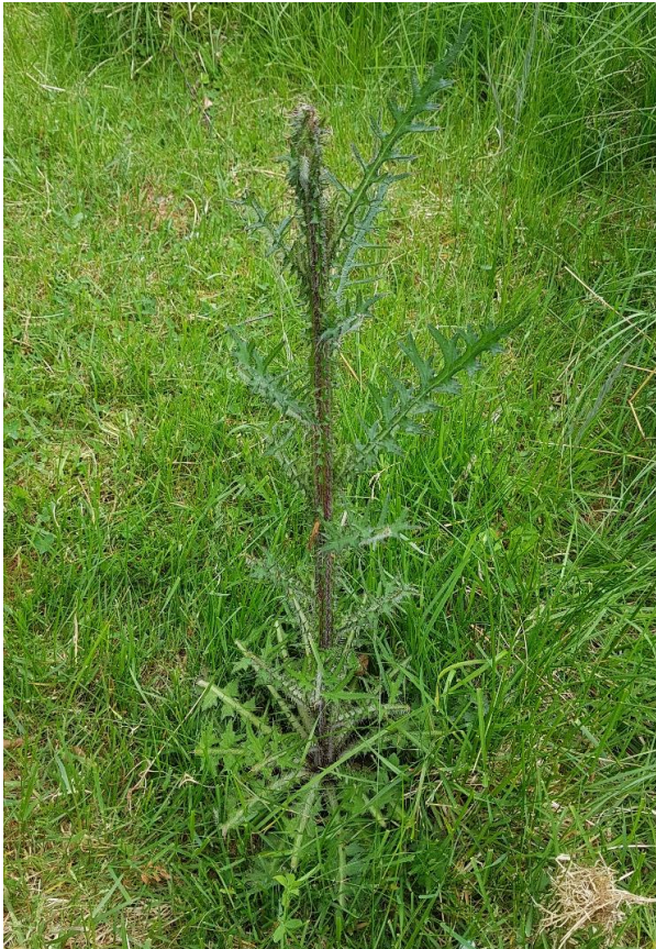
Myrtistel som sauer har beita knoppene av.