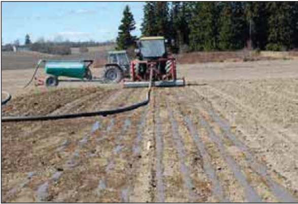
Bilde 1. Spredning av biorest med forsøks-DGI.