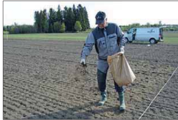
Bilde 2. Spredning av pulver basert på matavfall.