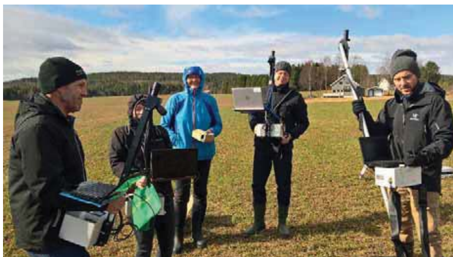
Bilde 1. Kalibrering av Yara N-sensorer.