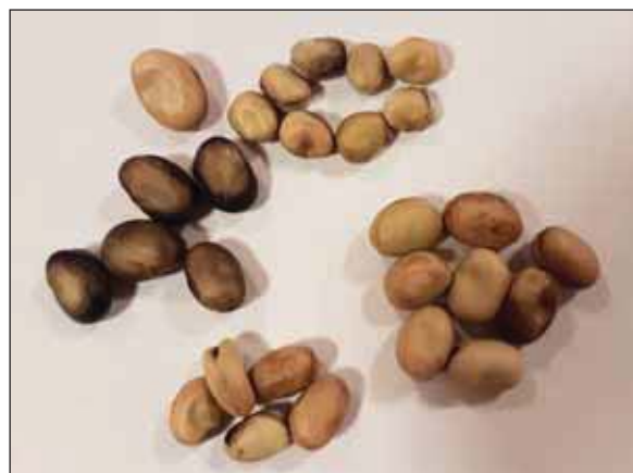
Bilde 1. Det er stor forskjell i frøstørrelsen hos ulike åkerbønnesorter.

Plantehøyden til sortene varierer mye, de tidlige finske sortene er kortvokste. Lielpatones er klart